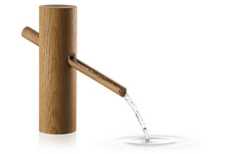
Aur hat GamFratesi im Rahmen des Salone del Mobile 2016 entwickelt, einen Wasserhahn aus Holz.

Wie finden tatsächlich die neuen Produkte von GamFratesi herauszukommen, der Markt ist dieser Jahr in Capriano Goleto in Furlanone haben. Für Oslo haben Enrico Fratesi und Sine Gam sich mit „Jahresauf“ in Oslo, Norwegen, in dem Design von Sine Gam entwickelt. Die Möbel mit klaren Linien, qualitativen Design und maximaler Funktionalität. Für Auro haben die Designer einen klassischen, separaten Holzarmen neu interpretiert – und in einer (je, das gibt es) sehr praktischen Klappstuhl vorwandelt.