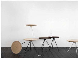
Die Table Collector für zwei.